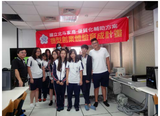
說明：與參加研習學生合影