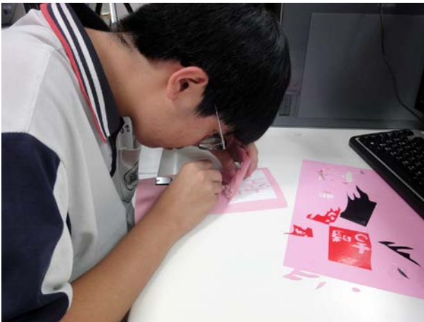
說明：學生操作情形