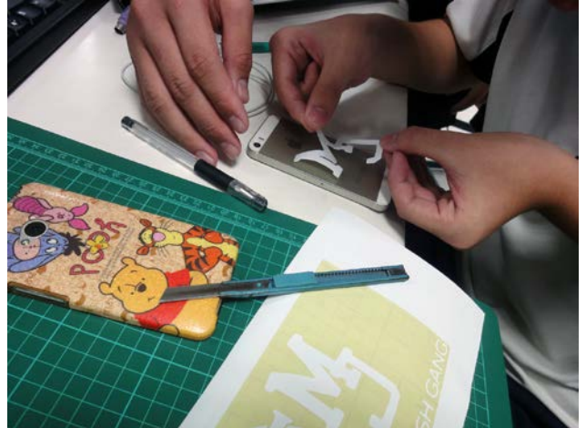
說明：學生操作情形