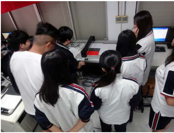
說明：講解切割機操作流程

時間：民國 104 年 10 月 24 日 地點：微型創業育成工坊 項目：103-2 技能卓越-專題製作-切割應用實務一