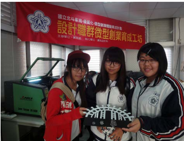
說明：學生與作品合影