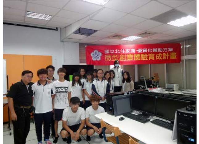
說明：與參加研習學生合影